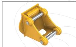
Platine de montage